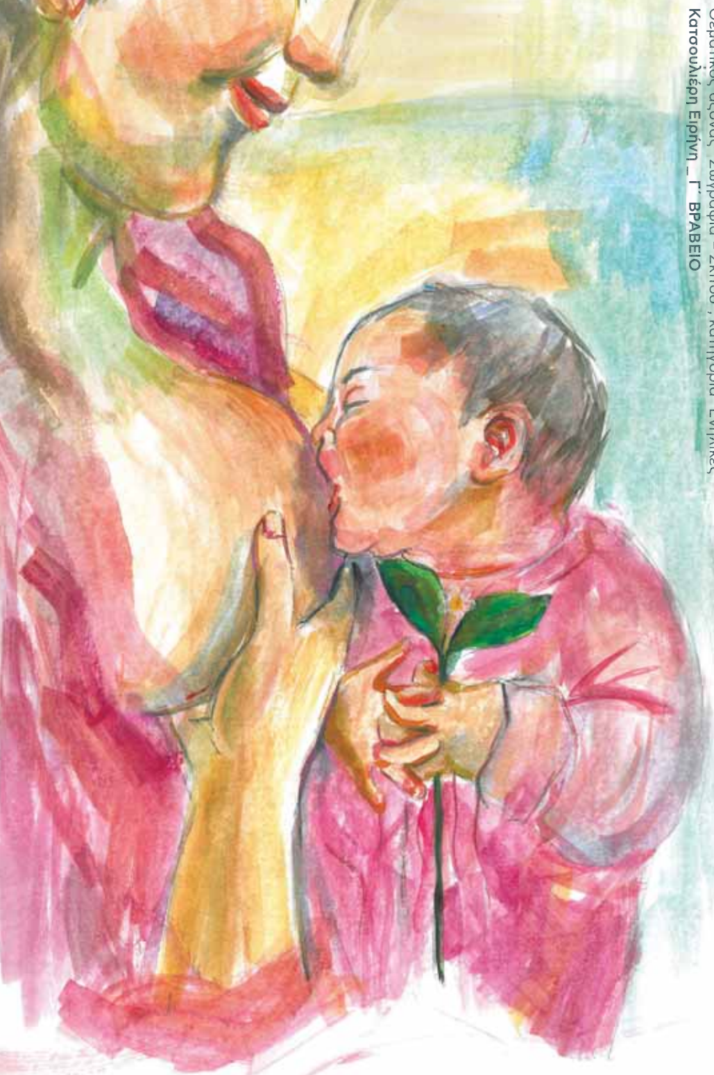
Καλλιτεχνικός Διαγωνισμός με θέμα: «Μητρικός Θηλασμός: Θεματικός άξονας "Ζωγραφιά - Σκίτσος", κατηγορία "Ενήλικες" Καρουλιέρα Ειρήνη - Γ' ΒΡΑΒΕΙΟ